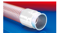
CONNECT 243 FOOD