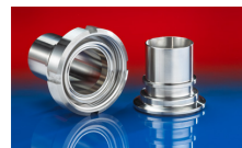
CONNECT ASEPTIC FITTING 249