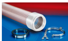
CONNECT 245 FOOD