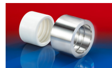
CONNECT PRESS ASSEMBLY 232