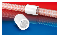
CONNECT 246 FOOD

Über- und Unterdruck sind empfohlene Betriebsgrenzwerte, auf Anfrage können Produkte höher belastet werden. Biegeradius gemessen an der Innenseite des Schlauchbogens. Weitere Technische Daten unter www.norres.com . Technische Änderungen vorbehalten. Alle Werte wurden bei 20°C ermittelt und sind ca. Angaben.