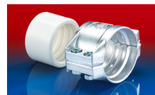
CONNECT SAFETY CLAMP ASSEMBLY 231