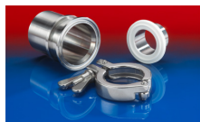
CONNECT TRI-CLAMP FITTING 245