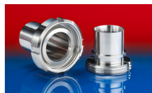
CONNECT DAIRY FITTING 247