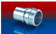
CONNECT THREAD FITTING 234