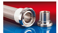
CONNECT MOULD ASSEMBLY 233