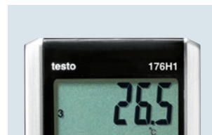
Großes und übersichtliches Display zur Messwertanzeige