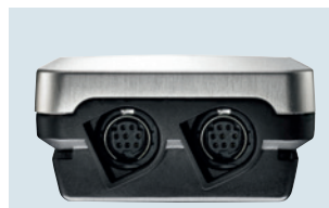
Fühleranschlüsse am unteren Gehäuseende für zwei Temperatur-/Feuchtefühler