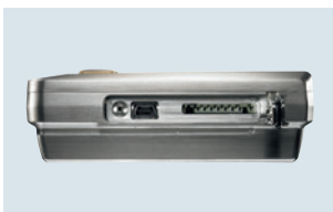
Seitlicher Anschluss von Mini-USB-Kabel und SD-Karte