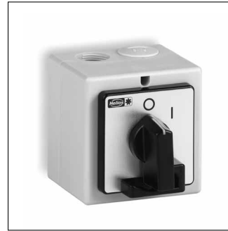
MONTAGE- UND BETRIEBSVORSCHRIFT NR. 94923

Zur Sicherstellung einer einwandfreien Funktion und zur eigenen Sicherheit sind alle nachstehenden Vorschriften genau durchzulesen und zu beachten