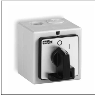
MONTAGE- UND BETRIEBSVORSCHRIFT NR. 94923

Zur Sicherstellung einer einwandfreien Funktion und zur eigenen Sicherheit sind alle nachstehenden Vorschriften genau durchzulesen und zu beachten